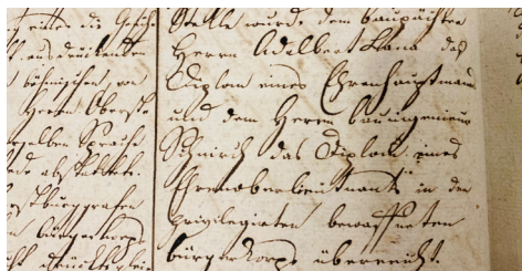
transliterace, transkripce a překlad: PhDr. Miroslav Kunštát, Ph.D.

Když pak Jeho Excelence pan Nejvyšší purkrabí pozvedl číši na blaho a prospěch města Prahy, odměnili se mu přítomní měšťané bouřlivým Vivat, kterému se v celém shromáždění dostalo co nejhlasitější odezvy. Tím byla zakončena slavnost, která nikdy nevymizí z paměti pražských obyvatel.