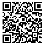
oprava elektřiny, topení a úprava sakristie