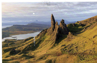
The Old Man of Storr, Isle of Skye