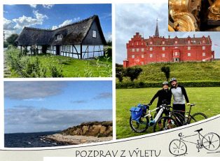
POZDRAV Z VÝLETU