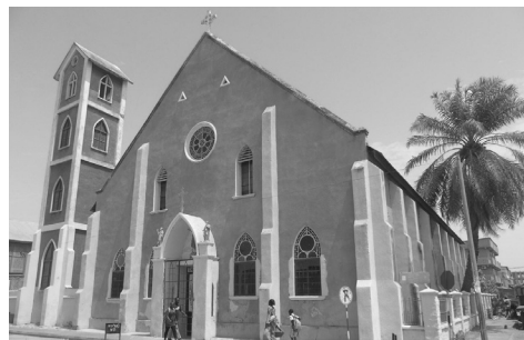
Katedrála Nanebevzetí Panny Marie, Banjul, Gambie

Co může udělat pro mír ve světě obyčejný člověk? Nic? Jen čekat, co udělají vlády světa a jak budou reagovat jednotlivé národy na různé národnostní nebo náboženské konflikty? Něco přece jen udělat můžeme. V několikaletém projektu Modlitba za svět putujeme doslova po celém světě: každé první pondělí v měsíci v 17:30 je u Sv. Gotharda sloužena mše za určitou zemi, po níž následuje přednáška, ukončená představením státní hymny. Celý měsíc se pak společně i osobně modlíme na úmysly, týkající se této země. Chceme prosit Boha za bezpečný svět, aby byl místem života nejen pro nás, ale i pro ty, kteří se teprve narodí.